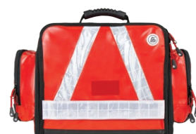
HERZmed WaterStop Notfalltasche FLEX