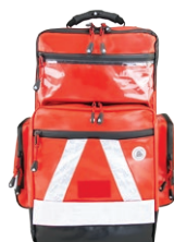
HERZmed WaterStop Notfallrucksack PRO