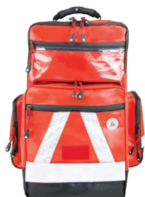
HERZmed WaterStop Notfallrucksack PRO