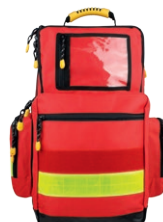
HERZmed Notfallrucksack YELLOW Large