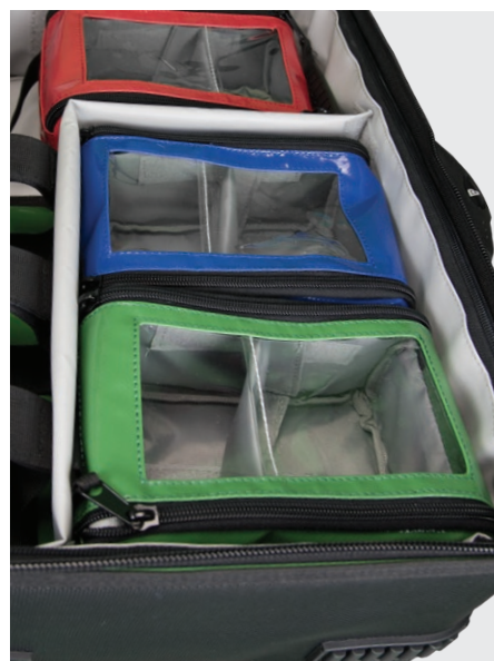
Modultasche S in X1 Notfallrucksack