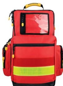
HERZmed Notfallrucksack YELLOW Large