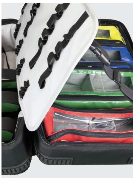
Modultasche L in X1 Notfallrucksack