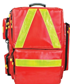
HERZmed WaterStop Notfallrucksack PROFI