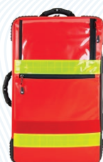
HERZmed PREMIUM Notfallrucksack X1