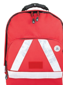
HERZmed WaterStop Notfallrucksack SMALL