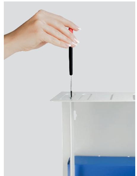
Schritt 3 Schrauben wieder fixieren