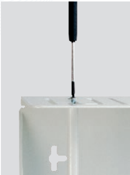
Schritt 1 Schrauben lockern