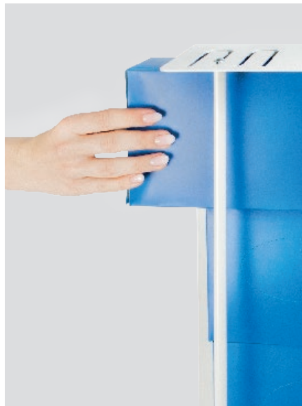
Schritt 2 Boxen einlegen, arretieren